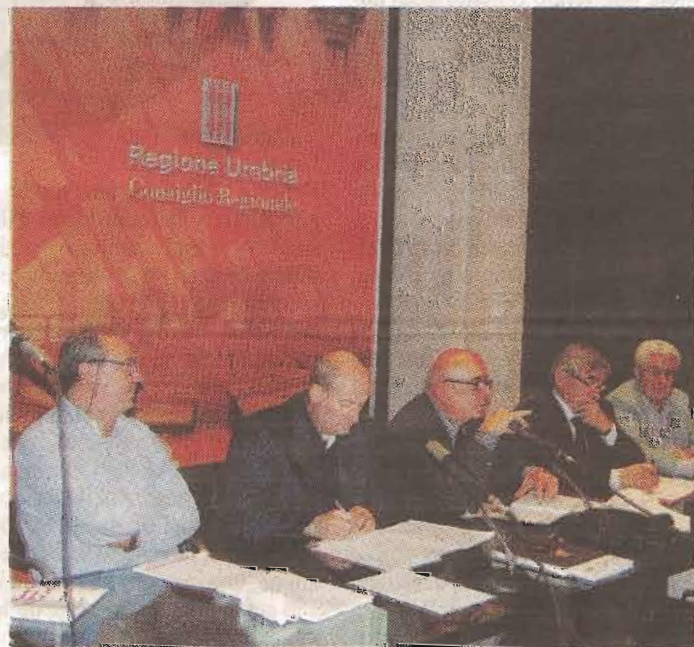
»» I rappresentanti dei sindacati pensionati

forma unitaria che va a rinnovare l'accordo siglato nella scorsa legislatura regionale, all'interno del percorso di aggiornamento del precedente Patto per lo sviluppo per definire una nuova Alleanza per l'Umbria. “In primo luogo - hanno spiegato - chiediamo che il Fondo per la non autosufficienza venga subito applicato e poi reso strutturale, dal 2011: in questo, la Regione deve impegnarsi per garantire le risorse necessarie, inserendole nel prossimo Dap. Inoltre, al di là dello stanziamento nazionale, chiediamo come sono stati spesi i fondi nel bilancio regionale 2008-2010 perché da parte di Comuni e Asl non c'è chiarezza. Chiediamo che vengano individuate misure finalizzate al recupero del potere d'acquisto delle pensioni, partendo dall'estensione della 14esima mensilità, fino ad interventi per alleggerire la pressione fiscale, ricorrendo a una contrattazione sociale con i Comuni per l'abbassamento di prezzi e tariffe. E interventi sulla prevenzione, che va finalizzata al recupero di risorse e alla valorizzazione della domiciliarità”.