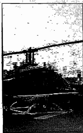
Un elicottero dei vigili del fuoco