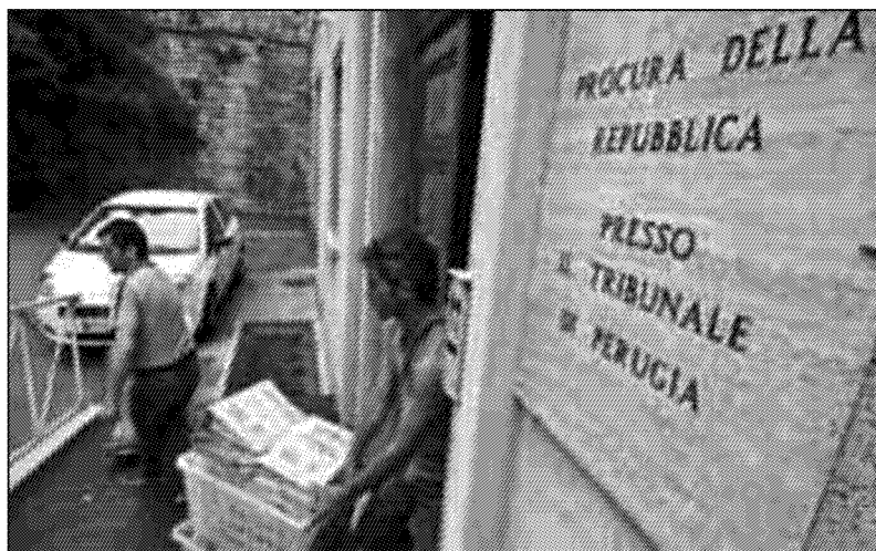
I fascicoli di Sanitopoli portati in Procura

Dalle intercettazioni ambientali alla Asl 3 la strada delle assunzioni